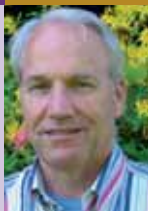
Door mr O.W. Borgeld juridisch adviseur FVNOIMHB