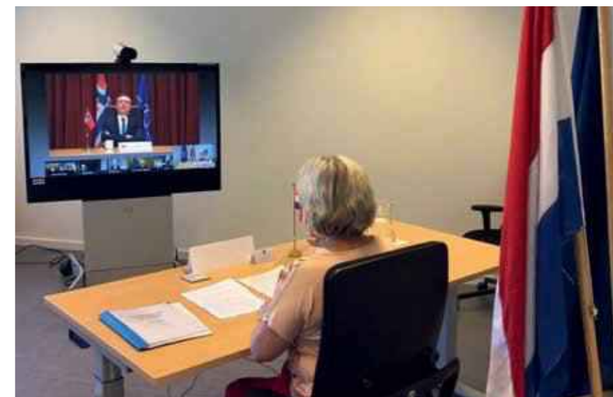
Niet alleen het georganiseerd overleg werkt middels alternatieve communicatiemiddelen, in dit geval een beveiligde videoconferentie. Onze minister Ank Bijleveld-Schouten bespreekt hier met haar NAVO-collega's de crisis. Het 'gewone' werk moet doorgaan!

Gelukkig is er door alternatieve manieren van werken wel voortgang geboekt. Het was voor de GOV|MHB essentieel dat de status van een cVRP kon worden veranderd naar VRP. Immers, het formele traject van de medezeggenschap moet nog gedaan worden. Het is logisch dat ook de medezeggenschap in deze tijd de nodige uitdagingen heeft om samen te kunnen overleggen, maar naar ik hoor doet men er ook daar alles aan om het werkbaar te maken. Zijn er dan geen vragen gesteld door de