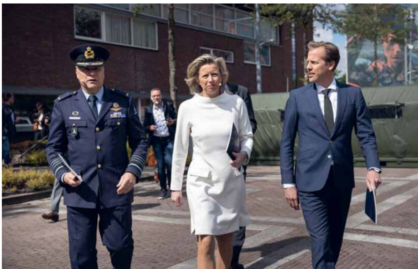
CDS generaal Onno Eichelsheim, minister Kajsa Ollongren en staatssecretaris Christophe van der Maat (v.l.n.r.) presenteren woensdag 1 juni de Defensienota 2022 op de Marinierskazerne in Rotterdam.

De oorlog in Oekraïne gaat onverminderd door. Dagelijks zien we de vreselijke gevolgen van de oorlog. Het blijft echter voor veel Nederlanders en Europeanen een vervan-mijn-bed-show, met uitzondering van de economische gevolgen voor ons kleine land. Ook de nieuwswaarde zal op termijn verminderen en zullen we er steeds minder over lezen op de voorpagina van de kranten. Vreemd eigenlijk, maar ook weer normaal, want prioriteit 1 ligt vaak alleen bij de eigen 'inner circle' en niet bij een ander. Veel mensen realiseren zich steeds meer dat wat er nu gebeurd in Oekraïne niet alleen grote ge-