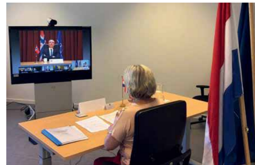
Niet alleen het georganiseerd overleg werkt middels alternatieve communicatiemiddelen, in dit geval een beveiligde videoconferentie. Onze minister Ank Bijleveld-Schouten bespreekt hier met haar NAVO-collega's de crisis. Het gewone werk moet doorgaan!

Gelukkig is er door alternatieve manieren van werken wel voortgang geboekt. Het was voor de GOV|MHB essentieel dat de status van een cVRP kon worden veranderd naar VRP. Immers, het formele traject van de medezeggenschap moet nog gedaan worden. Het is logisch dat ook de medezeggenschap in deze tijd de nodige uitdagingen heeft om samen te kunnen overleggen, maar naar ik hoor doet men er ook daar alles aan om het werkbaar te maken. Zijn er dan geen vragen gesteld door de