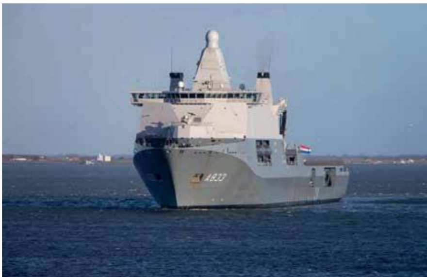
Zr.Ms. Karel Doorman is vertrokken naar het Caribisch gebied voor hulp aan de coronacrisis. Deze foto is gemaakt in januari 2015 in Den Helder. Toen zijn er, ter bestrijding van ebola, goederen geleverd aan de Afrikaanse westkust.

CLAS c-VRP 1667 Versterken Vuursteun: Het versterken van de vuursteun is een cruciale stap in het herstellen van de balans tussen combat en combat support capaciteit. Door het kwantitatief en kwalitatief versterken van het VustCo, en 41 e Afdeling Artillerie in het bijzonder, is de eenheid beter in staat de slagkracht van CLAS en CZSK-eenheden te versterken met grondgebonden vuursteun. CLSK cVRP inzake Oprichting CLSK Expertise Centrum Diensthonden (CEC-D): Doel van deze reorganisatie betreft de oprichting van een CLSK Expertise Centrum Diensthonden (CEC-D) op de Vliegbasis Woensdrecht. Met de oprichting van CEC-D wordt invulling gegeven aan de behoefte aan borging van kennis, expertise en netwerken in relatie tot het operationele gebruik van Military Working Dogs (MWD).