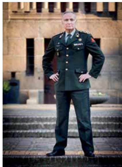
Dagelijks voelen we de tekortkomingen

Het personeel van Defensie wacht samen met de rest van Nederland de tekst van het nieuwe regeerakkoord af. Het wordt dus best spannend na de zomervakantie.