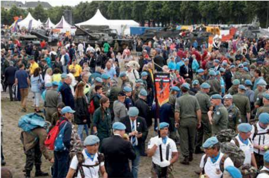
Veteranen van allerlei missies kwamen bijeen op het Malieveld.

Op 24 juni 2017 was het weer de Nederlandse Veteranendag. De dag waar Nederland zijn meer dan 117.500 veteranen, mannen en vrouwen, bedankt voor hun inzet in dienst van de vrede, nu en in het verleden.