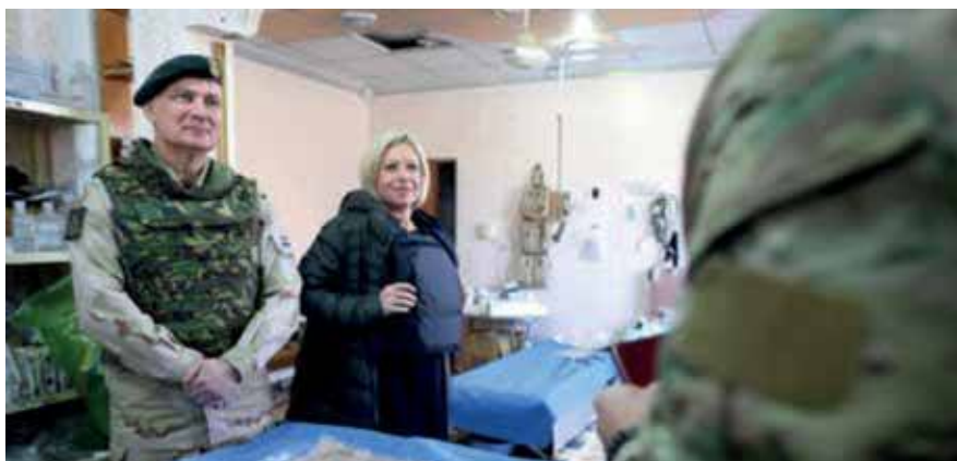
Minister en CDS samen op pad in Irak. Politieke debatten gaan nu over hoe veel geld erbij moet voor Defensie

Stel je eens voor: er komt een regeerakkoord eind augustus, begin september 2017