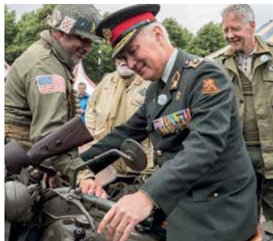
CDS generaal Tom Middendorp hoort van de eigenaar: Die is zeker niet te koop!

Aansluitend volgde een waardige ceremonie op het Binnenhof, waarbij vele veteranen in het zonnetje werden gezet, met een onderscheiding voor hun inzet voor Nederland. Onze demissionaire minister van Defensie benadrukte in haar toespraak dat vrijheid geen vanzelfsprekendheid is. Ik heb haar dit ook mogen horen zeggen tijdens de herdenkingen in Normandië in het kader van 70 jaar D-DAY. Toen nog als projectofficier Nederland voor dit evenement.