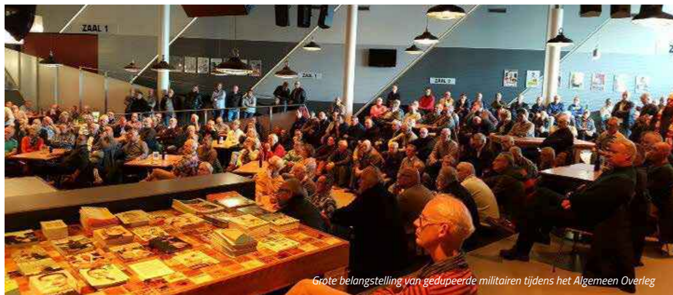
Grote belangstelling van gedupeerde militairen tijdens het Algemeen Overleg

Het overleg van de afgelopen maanden in de Tweede Kamer met betrekking tot het AOW-gat in een aantal korte conclusies samengevat. Defensie voert het vonnis van de rechter uit en spreekt met geen woord over goed werkgeverschap. Het Kabinet laat Defensie vallen. Defensie moet onterecht de rekening grotendeels zelf betalen. De Tweede Kamer is het opvallend eensgezind oneens met het Kabinet.