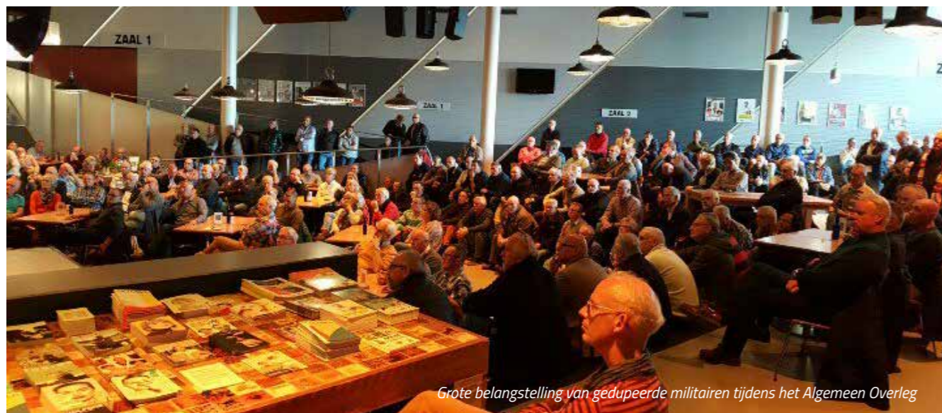
Grote belangstelling van gedupeerde militairen tijdens het Algemeen Overleg

Het overleg van de afgelopen maanden in de Tweede Kamer met betrekking tot het AOW-gat in een aantal korte conclusies samengevat. Defensie voert het vonnis van de rechter uit en spreekt met geen woord over goed werkgeverschap. Het Kabinet laat Defensie vallen. Defensie moet onterecht de rekening grotendeels zelf betalen. De Tweede Kamer is het opvallend eensgezind oneens met het Kabinet.