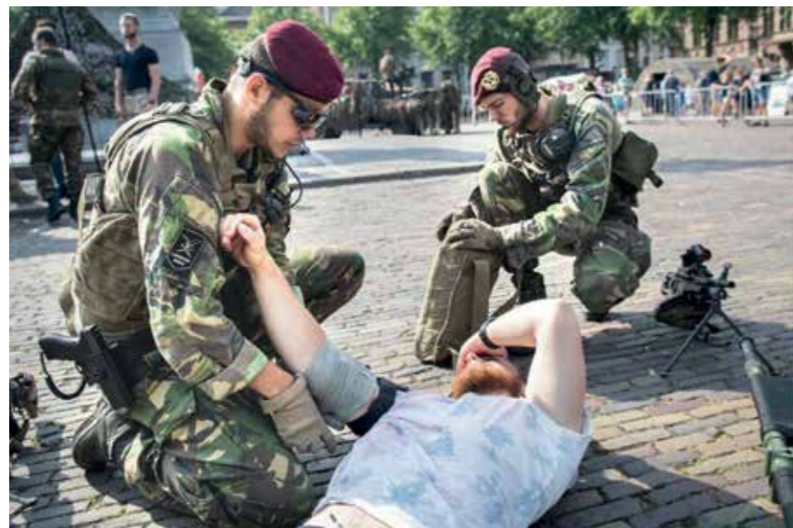
Militairen laten zien hoe ze eerste hulp verlenen tijdens de Landmachtdagen. Elke Nederlander moet op het defensiepersoneel (burger en militair) kunnen vertrouwen.

In het Algemeen Overleg Personeel Defensie van 22 mei jl. was het in ieder geval heel duidelijk dat ook alle politieke