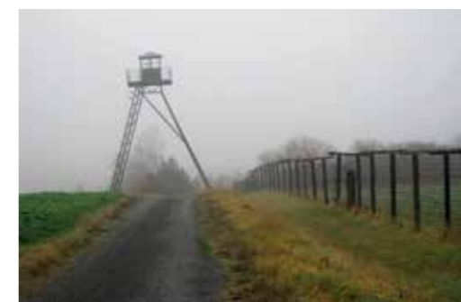
The Iron Curtain

In de context van gereed zijn kan ook de vorige column over het "vredesdividend" verder worden verklaard. Zelfs in economische termen, waarvan ik de vorige keer meldde dat het, zeker in Nederland, bijzonder dom is uitgewerkt. Zoals ik betoogde is vrede het dividend en niet in geld uit te drukken. Wat echter wel in geld is uit te drukken is het oorlog voeren. Oorlog voeren is namelijk erg duur. Niet alleen de directe kosten zijn erg hoog, vele malen hoger dan in vredetijd. Maar vooral de indirecte kosten voor de economie zijn astronomisch. Als u dacht dat een handelsoorlog kostbaar was, dan zou ik