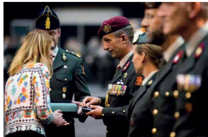
Staatssecretaris Visser heeft zojuist een herinneringsmedaille uitgereikt. Oprechte waardering, goed voor het herstel van het vertrouwen. Ook goed om je oude maten weer eens trots te zien zijn.

partijen bezorgd zijn over de ondervulling bij Defensie. Er zijn veel te veel vacatures en ook gaan nog talloze procedures zeer bureaucratisch. Denk hier bijvoorbeeld aan het aannemen van herintreders. Ook daar zullen oplossingen voor moeten worden gezocht.