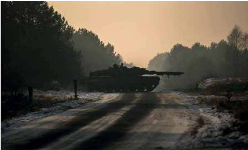
Oefening Bison Drawsko, confronterend is het wel dat de tekortkomingen van - en pijnpunten binnen - de KL zichtbaar worden.

Op dit moment behoort Nederland in Europa tot de meest welvarende landen met een sterke economie. Ondanks dat hebben wij met z'n allen niet kunnen voorkomen dat Defensie door het ijs gezakt is. Wel kunnen wij met elkaar constateren dat in de huidige verkiezingstijd veel politieke partijen dure beloften aan de kiezers doen. Maar helaas weet ook iedereen dat dit weer beloften zijn die de politieke partijen straks niet kunnen waarmaken. Veel partijen rekenen zich rijk en zijn nu al aan het potverteren. Defensie is daarbij een van de onderwerpen.