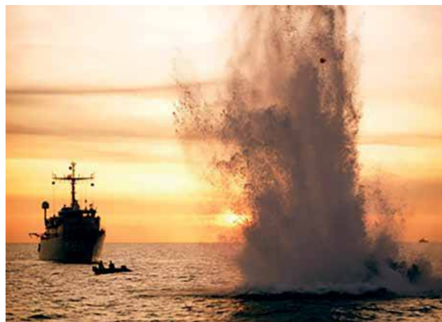
Vervanging van de mijnenbestrijdingsvaartuigen verre van zeker

Hoe staat Nederland ervoor? De politie is de afgelopen jaren gegroeid van 48.000 naar 63.000 man en zit nu in een moeizame reorganisatie naar een Nationale Politie. Maar de politie, in samenwerking met sociaal werkers, staat dicht bij burgers en zijn in de maatschappij aanwezig. Er zijn op dit gebied goede voorwaarden geschapen om de uitdagingen gesteld aan de interne veiligheid het hoofd te kunnen bieden. De AIVD had recent een groot aantal medewerkers moeten ontslaan als gevolg van bezuinigingen in 2012. Deze reducties zijn inmiddels ongedaan gemaakt, er wordt geïnvesteerd en men is bezig de opgelopen achterstand in te halen. Iedereen die dit soort werk kent, weet echter dat het nog jaren gaat duren voordat de opgelopen achterstanden zijn ingehaald.