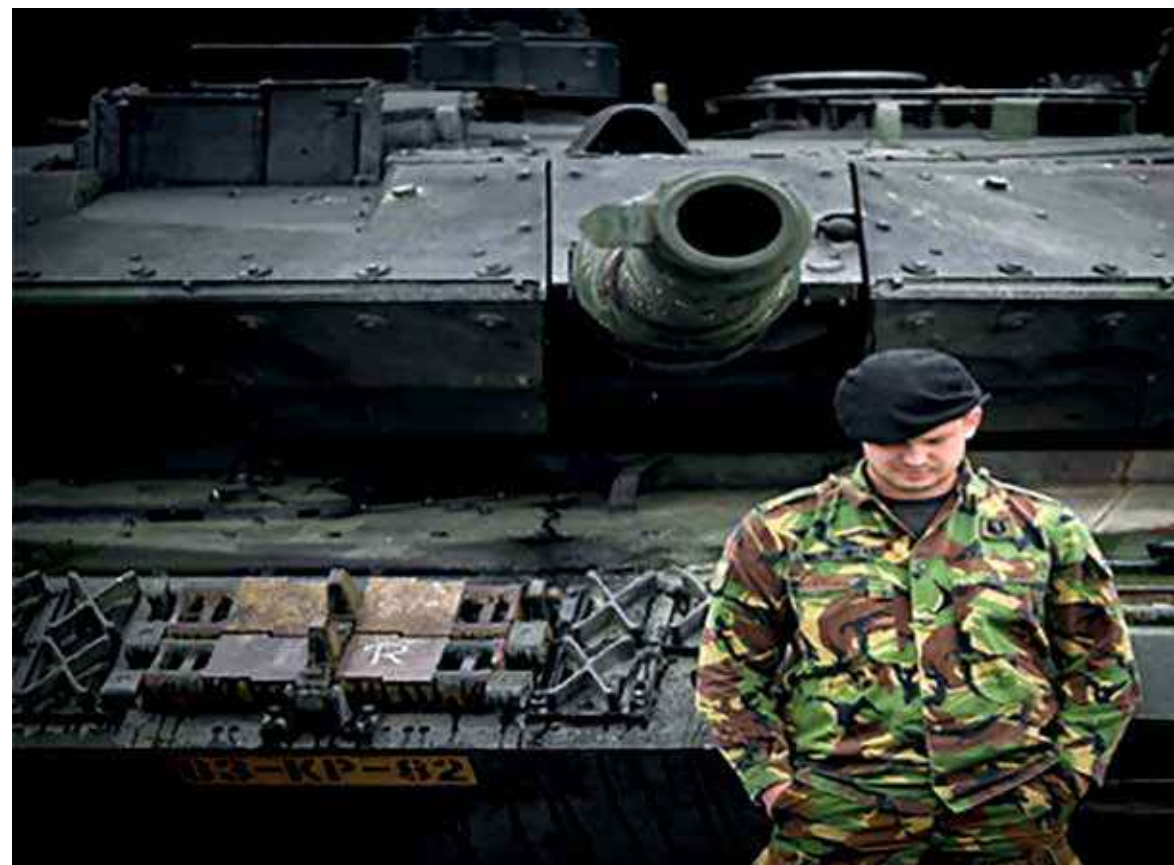
Defensie nam in 2012 afscheid van de tank om in 2015 er 18 te leasen van Duitsland

Als laatste belangrijke speler in het veiligheidsveld; Defensie. In 2019 bezuinigt dit departement, ondanks diverse intensiveringen, in re' le bedragen nog steeds meer dan 100 miljoen. Het BBP is onlangs wederom her-berekend, waardoor minister Dijsselbloem, overigens zonder een spier te vertrekken, voor de tweede keer vele honderden miljoenen aan Brussel mocht overmaken. Onze Defensiemiddelen zakken t.o.v. het BBP dan ook steeds verder weg. Wanneer wij de inkoop van de pensioenen ervan aftrekken, zitten wij al onder de 1%. Kijkend naar een Europees gemiddelde van 1,43%, ligt er een gat van, exclusief pensioenen, van tenminste 2,3 miljard. Ten opzichte van de in Wales toegezegde 2%, een kloof van meer dan 6 miljard.