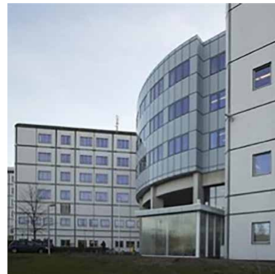
In het Centraal Militair Hospitaal zal ook de klachtenregeling aangepast moeten worden.