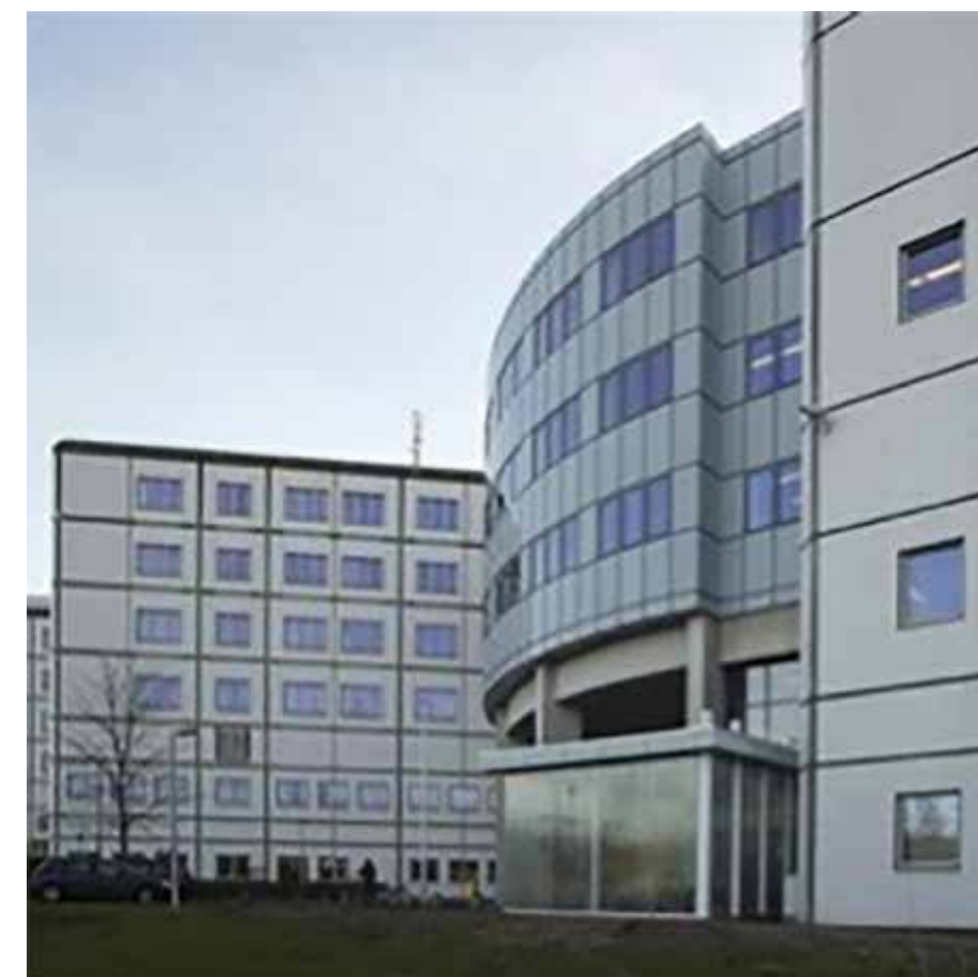
In het Centraal Militair Hospitaal zal ook de klachtenregeling aangepast moeten worden.

een betere explicitering van de rol van de klachtenfunctionaris, in de zin van klachtenbegeleiding, bemiddeling en advisering; aanpassing van de termijn voor de klachtencommissie aan de wettelijke termijn;