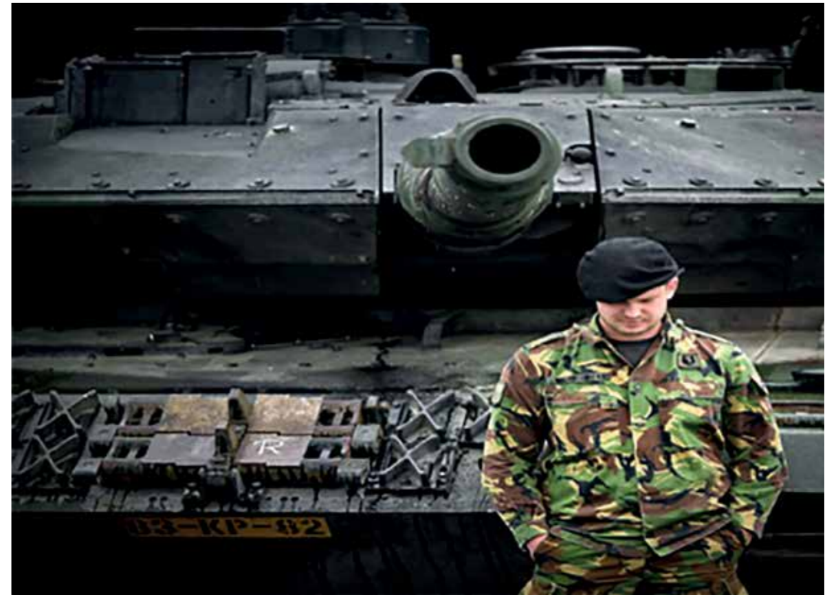
Defensie nam in 2012 afscheid van de tank om in 2015 er 18 te 'leasen' van Duitsland

Als laatste belangrijke speler in het veiligheidsveld; Defensie. In 2019 bezuinigt dit departement, ondanks diverse intensiveringen, in reële bedragen nog steeds meer dan 100 miljoen. Het BBP is onlangs wederom her-berekend, waardoor minister Dijsselbloem, overigens zonder een spier te vertrekken, voor de tweede keer vele honderden miljoenen aan Brussel mocht overmaken. Onze Defensiemiddelen zakken t.o.v. het BBP dan ook steeds verder weg. Wanneer wij de inkoop van de pensioenen ervan aftrekken, zitten wij al onder de 1%. Kijkend naar een Europees gemiddelde van 1,43%, ligt er een gat van, exclusief pensioenen, van tenminste 2,3 miljard. Ten opzichte van de in Wales toegezegde 2%, een kloof van meer dan 6 miljard.